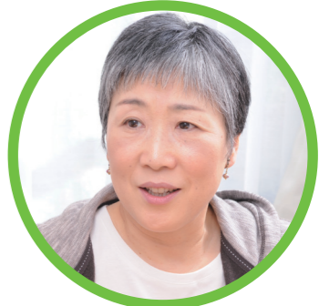
永井 愛さん 劇作家・演出家